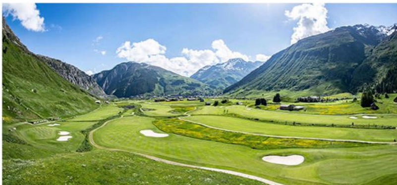
Andermatt, un écrin à 1440 mètres d'altitude.