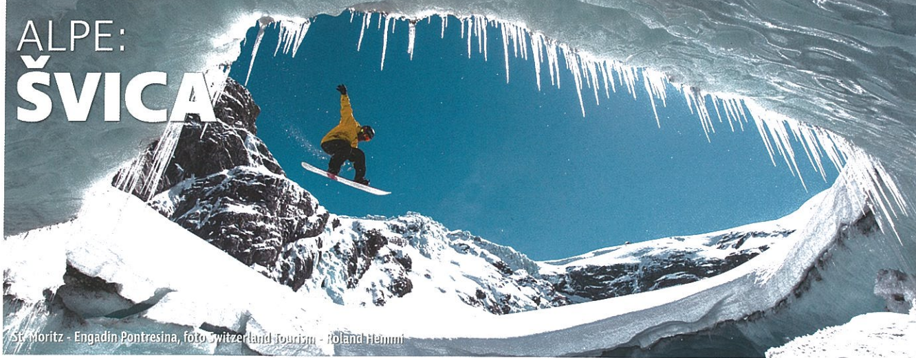
St. Moritz - Engadin Pontresina